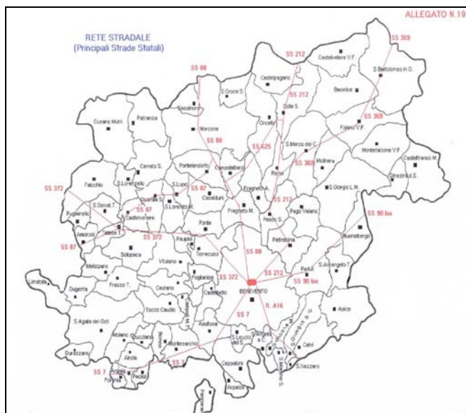
Rete stradale principale nella Provincia di Benevento

Il Fortore è attraversato dalle direttrici principali che lo collegano con Benevento: la SS 212 e la SS 369.